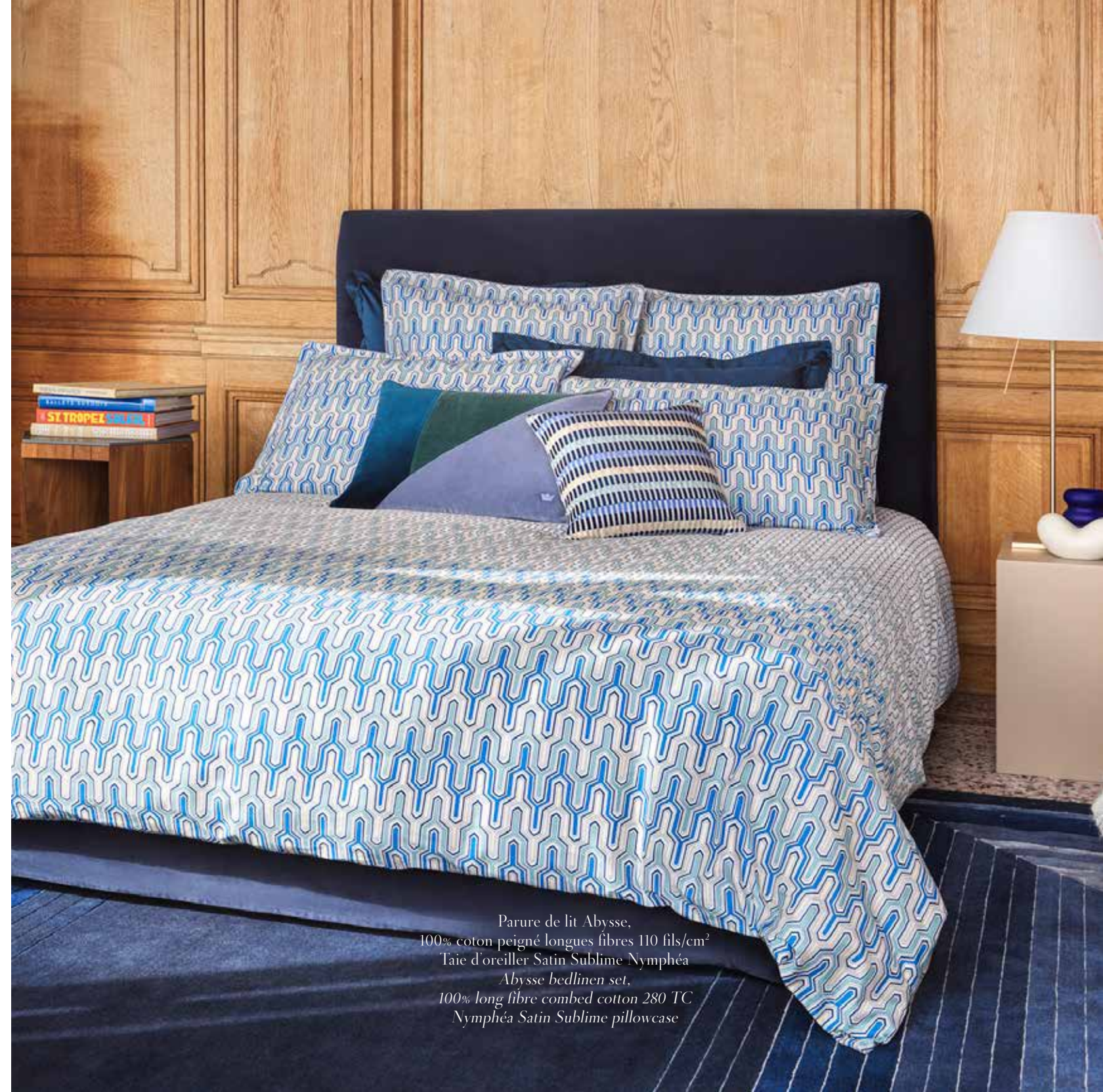
Parure de lit Abyesse, 100% coton peigné longues fibres 110 fils/cm 2 Taie d'oreiller Satin Sublime Nymphéa Abyesse bedlinen set, 100% long fibre combed cotton 280 TC Nymphéa Satin Sublime pillowcase

The deep of the ocean inspires a graphical and contemporary pattern in sophisticated blue shades mixed with green lights.