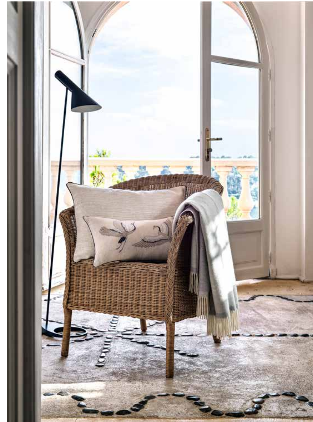
Coussin brodé - embroidered decorative cushion Héron, coussin - cushion Daphnis Ivoire et plaid Double Perle/Écru