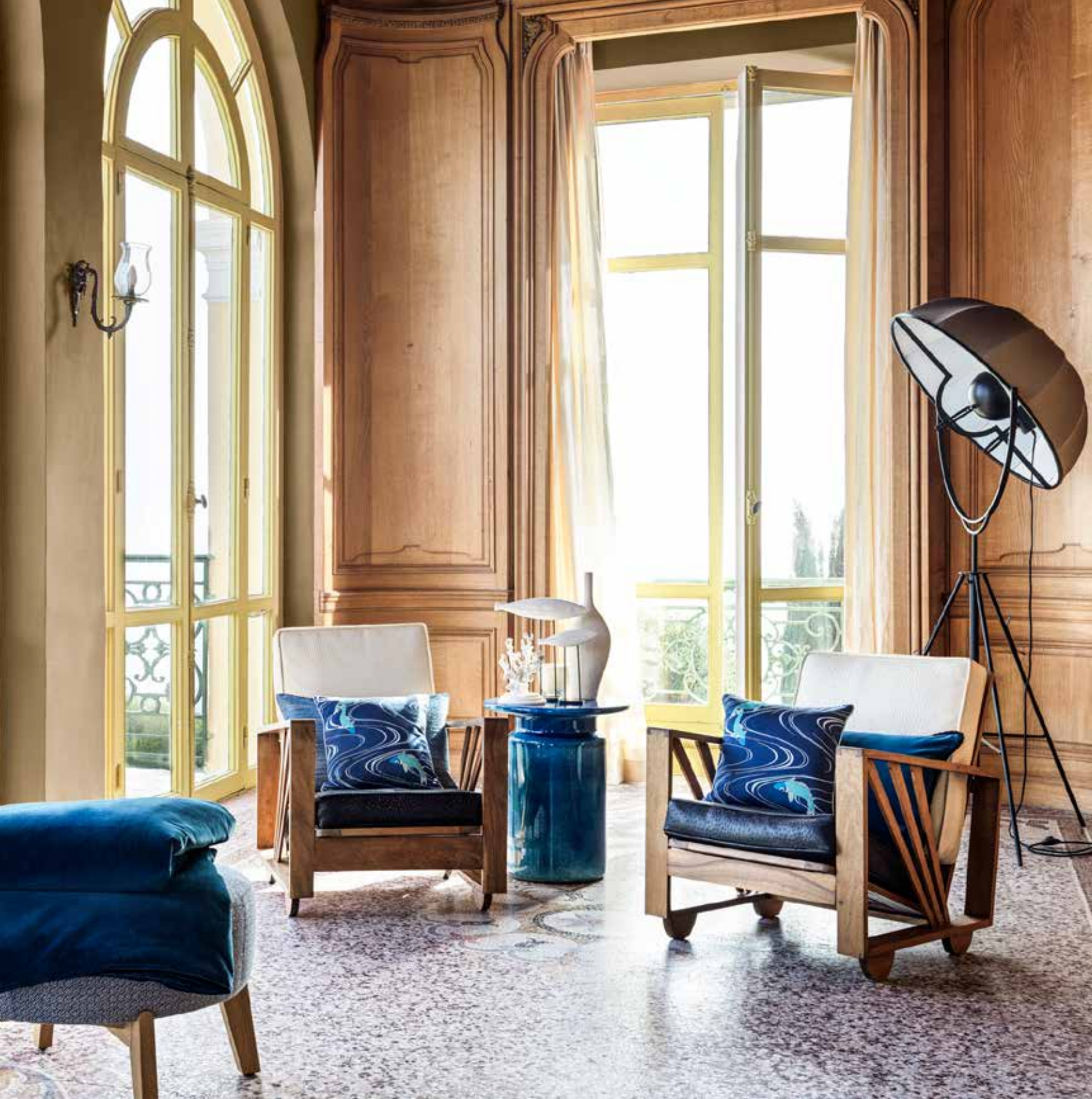
Coussins décoratifs Soleil Levant et Rêverie Bosphore, courtepointe Rêverie Bosphore Soleil Levant and Rêverie Bosphore Decorative cushions, Rêverie Bosphore quilted bedcover