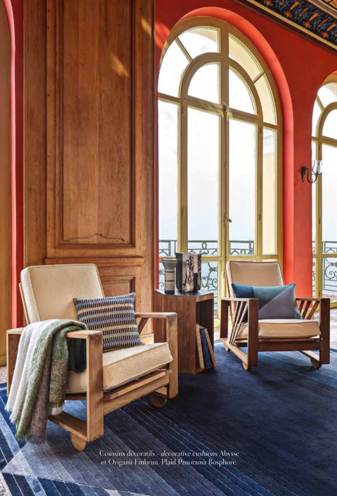
Coussins décoratifs - decorative cushions Abyesse et Origami Embrun. Plaid Panorama Bosphore.